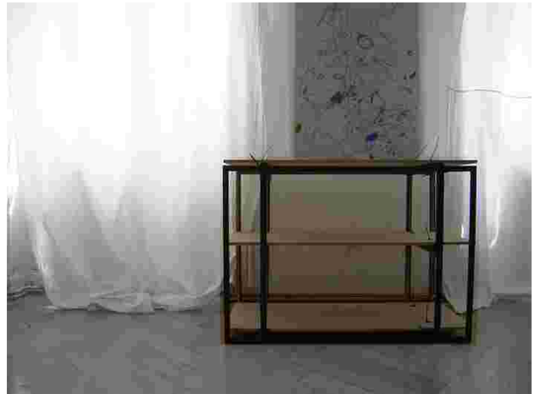
Regal Vintagebilderrahmen MDF/Kabelbinder